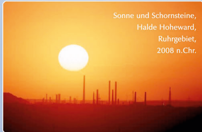
Sonne und Schornsteine, Halde Hoheward, Ruhrgebiet, 2008 n.Chr.

Die Horizontebene ist mit Peilmarken versehen, die bedeutsame Stände der Sonne im Horizont kennzeichnen (z.B. an den Tagen der Sonnenwenden: 20./21. Juni und 21./22. Dezember). Bei der Beobachtung aus der Mitte des Observatoriums steht die Sonne an diesen Daten kurz nach ihrem Aufgang bzw. kurz vor ihrem Untergang hinter Peilmarken und durchstrahlt ein Rundfenster, wodurch das besondere Datum angezeigt wird. Vergleichbare Beobachtungsmöglichkeiten gibt es für den Mond und einige Fixsterne.