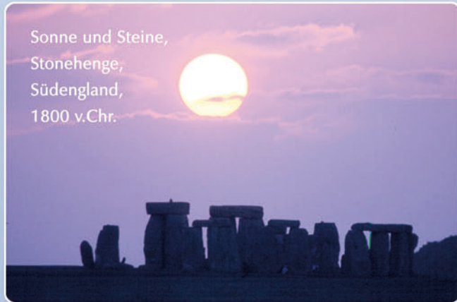
Sonne und Steine, Stonehenge, Südengland, 1800 v.Chr.

Die dafür entwickelte Architektur, in der die Symmetrien des Himmels und die Zyklen der Gestirne zum Ausdruck kommen, dient der Wiederbelebung uralter Techniken der Zeitbestimmung. Schon in der Steinzeit kamen in vergleichbaren Bauwerken und Kreisanlagen Beobachtungstechniken zur Anwendung, wie sie im Horizontobservatorium wieder aufleben sollen.